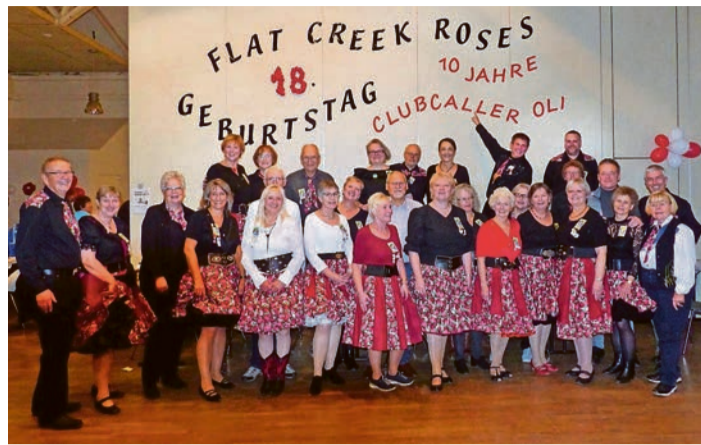
Der Square Dance Club „Flat Creek Roses e.V.“

Bergisch Gladbach. Der Square Dance ist ein in den USA entstandener Volkstanz, bei dem zu Klängen von Country- und Popmusik in Gruppen zu je vier Paaren, die zu Beginn auf den vier Seiten eines Quadrats (square) stehen, getanzt wird. Dabei gibt ein Caller, passend zum Rhythmus der Musik, durch Ansagen (Calls) eine immer wieder wechselnde Figurenfolge vor. Hierbei steht natürlich der Spaß im Vordergrund, der aus der Bewegungsfreude in Gemeinschaft erwächst, auch wenn die Abläufe durchaus Konzentration und Koordinationsfähigkeit erfordern.